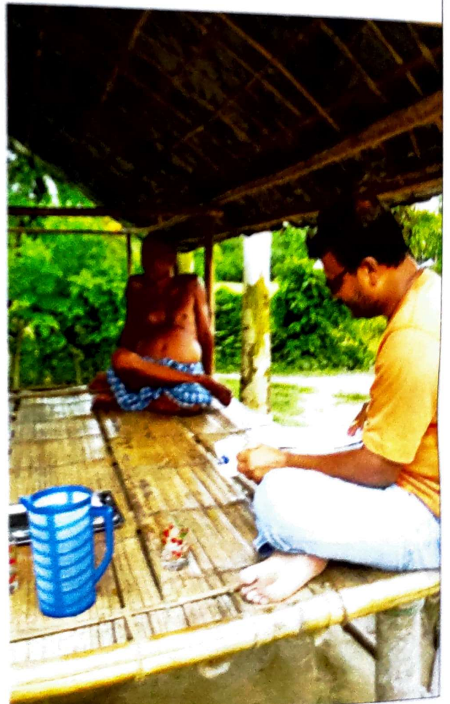
Figure 4 : Author with Kalipada Barman